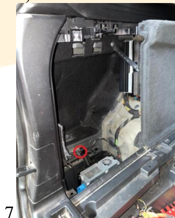
Рисунок - 4