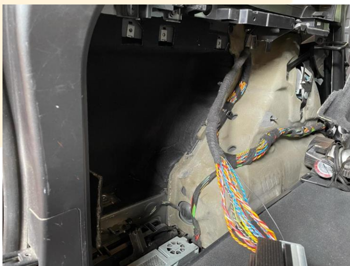
Рисунок – 1