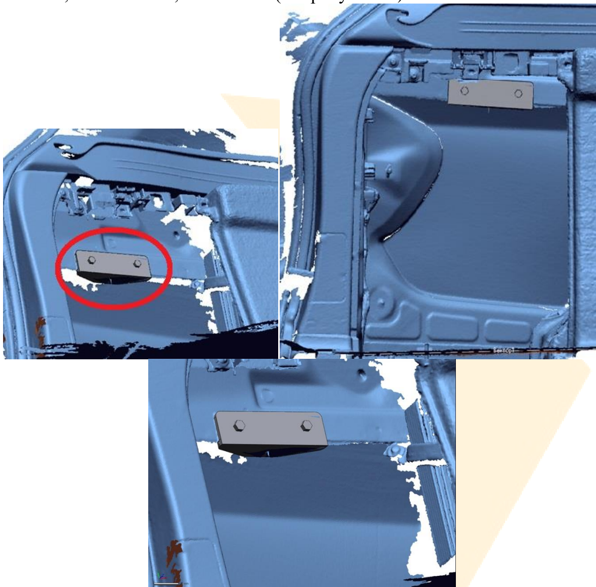
Рисунок - 5

5. Устанавливаем металлический уголок, используем 2 болта м6 20 мм , 4 шайбы м6 , 2 гайки м6 (см. рисунок -5)