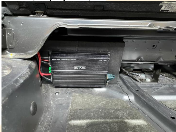
Рисунок - 3